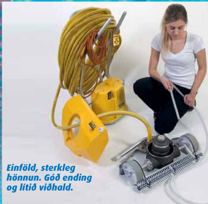
Einföld, sterkleg hönnun. Góð ending og lítið viðhald.

Piraya botnsugan hentar jafn vel í ferhyrningslaga sundlaugum sem í hringlaga sundlaugum eða sundlaugum með öðru lagi.