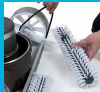
Einfalt að hreinsa burstana.