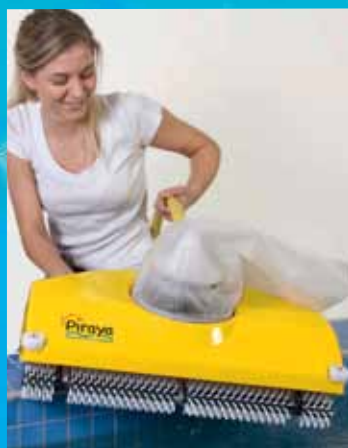
Létt í meðförum, aðeins 15 kíló Hraðvirkir snúningsburstar og mikil sogkraftur.