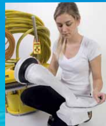
Sían opnast með einu handtaki fyrir skolon.