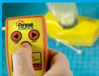
Hægt að nota sjálfvirkt forrit eða þráðlausa fjarstýringu