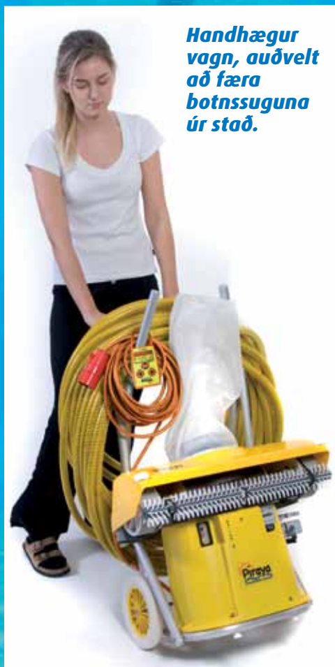
Handhægur vagn, auðvelt að færa botnsuguna úr stað.